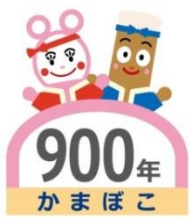
* かまぼこ 900 年ロゴ