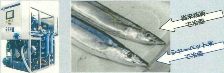
連続式シルクアイス® システム『海氷』