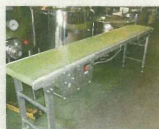
ベルトコンベヤー